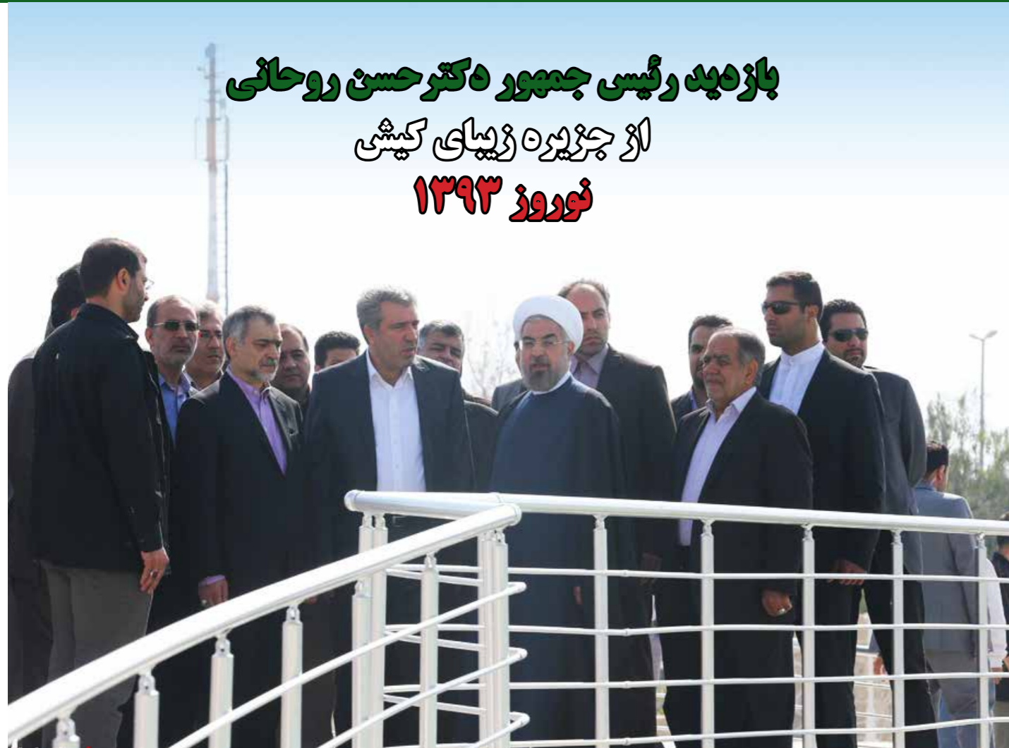
بازدید رئیس جمهور دکتر حسن روحانی از جزیره زیبای کیش نوروز ۱۳۹۳