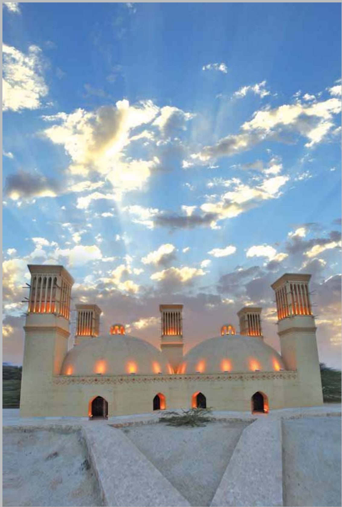
آب انبار - جزیره زیبای کیش