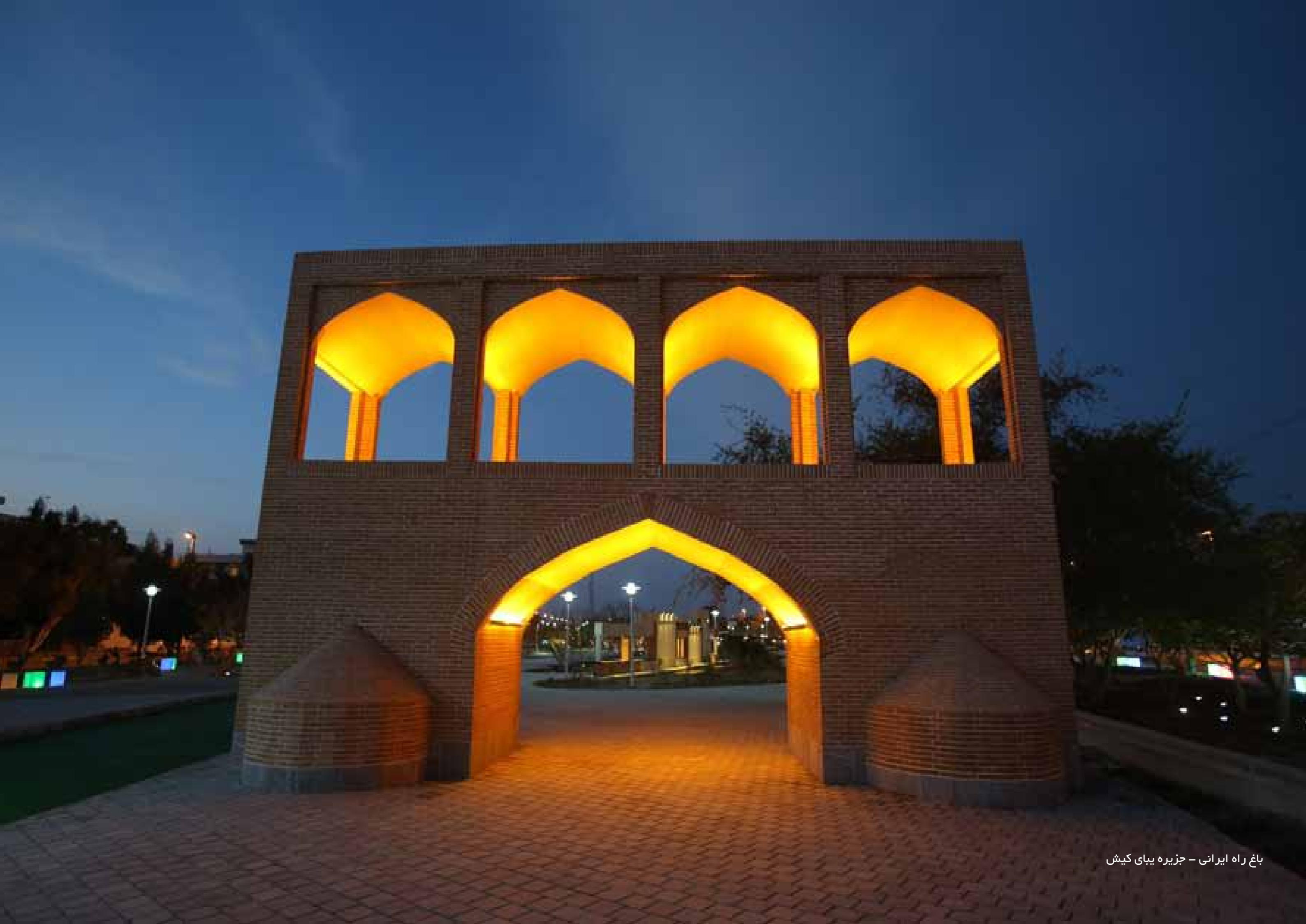
باغ راه ایرانی - جزیره بیای کیش