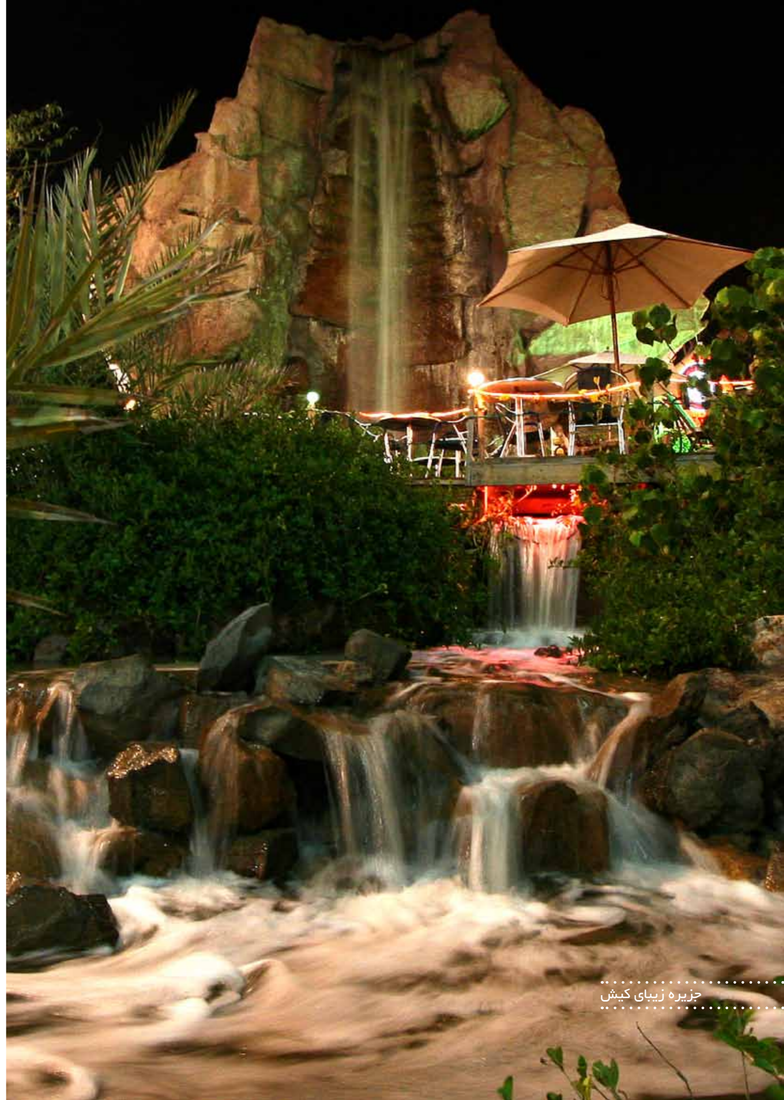
جزیره زیبای کیش