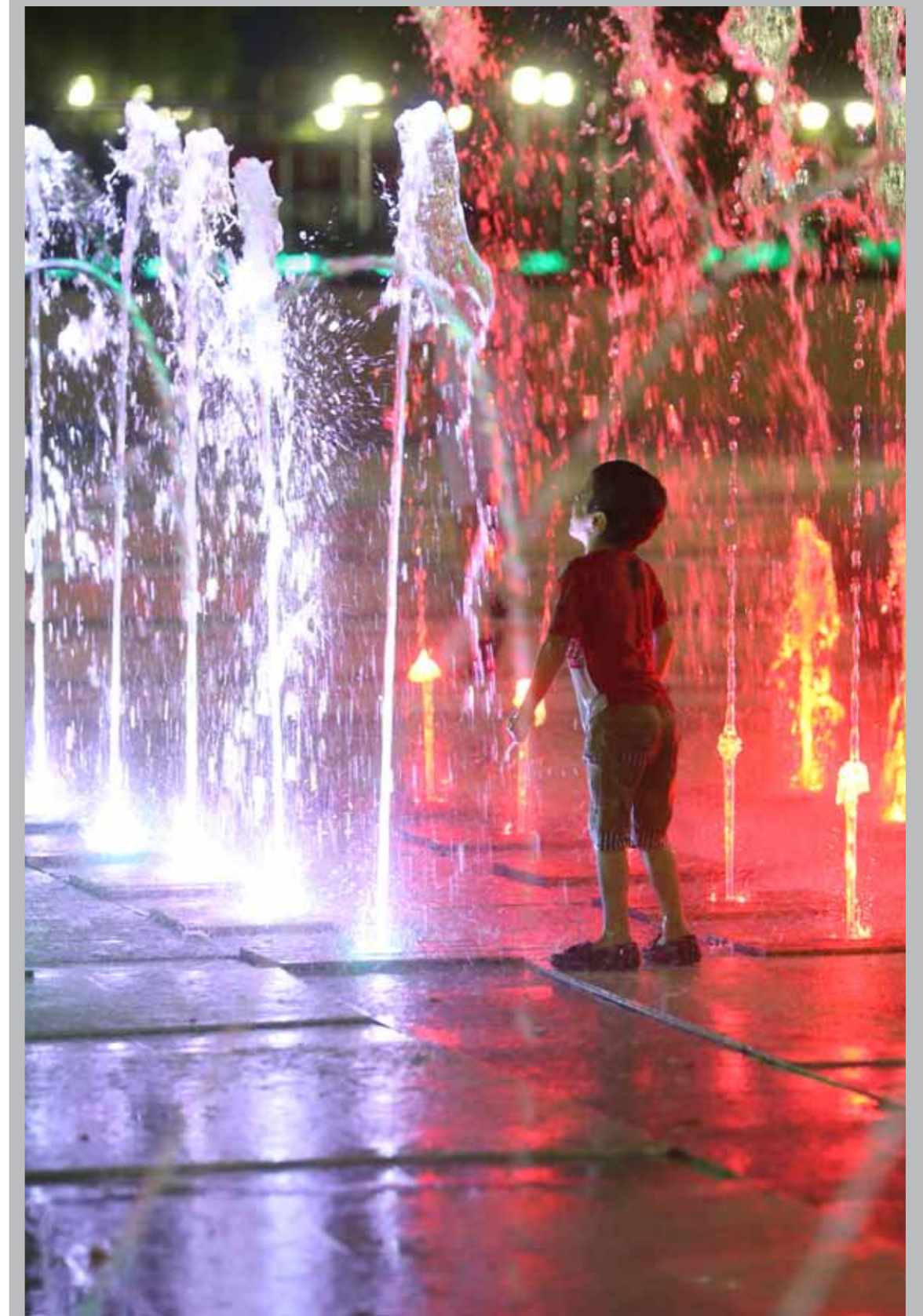
شادی کودکانه - پارک شهر، جزیره یبای کیش